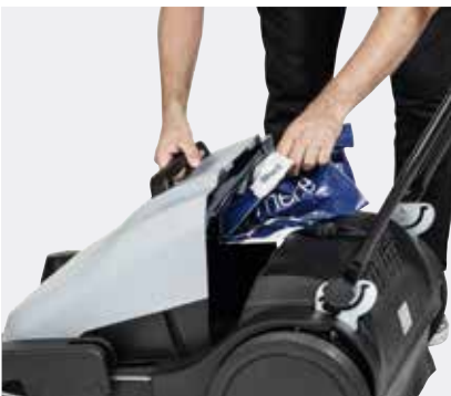
Der Schmutzbehälter kann offen gehalten werden, um größere Gegenstände hinein zu werfen oder um den Abfallbehälter zu entleeren.