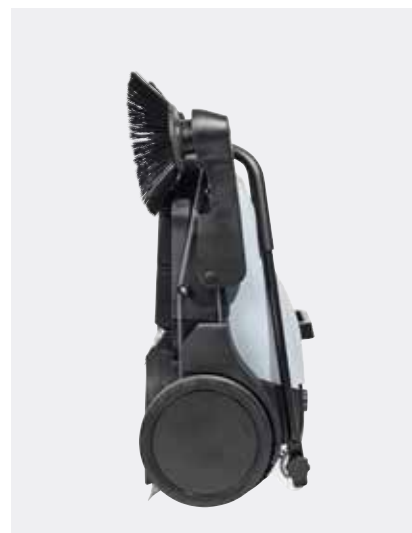
Der Kehrgutbehälter bleibt an Ort und Stelle, auch wenn die Kehrmaschine in einer aufrechten Position aufbewahrt oder an die Wand gehängt wird.