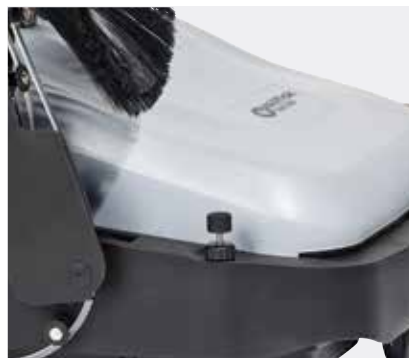
Die Hauptkehrwalze und die Seitenbesen können ohne Werkzeug eingestellt werden.