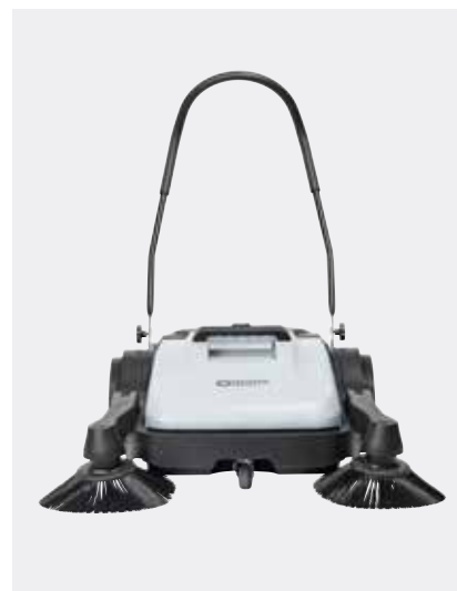
SW200 mit einem Seitenbesen und SW250 mit zwei Seitenbesen bieten Arbeitsbreiten von 70 cm bzw. 90 cm.