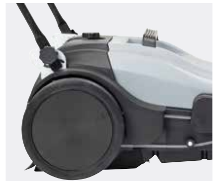
Der Griff kann auf die gewünschte Arbeitshöhe eingestellt oder für eine platzsparende Aufbewahrung auch komplett eingeklappt werden. Insgesamt sind 3 Einstellungen möglich.