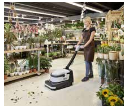
Böden leicht und schnell reinigen – gleichzeitig kehren, scheuern und saugen.